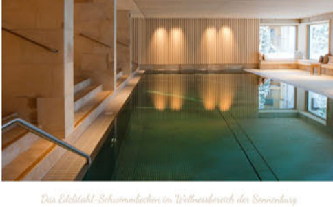
Das Edelstahl-Schwimmbaden im Wellnessbereich der Sonnenburg

Unsere Familiensauna liegt direkt neben dem Swimmingpool. Nachmittags kann die ganze Familie hier gemeinsam saunieren. Die finnische Sauna stärkt Ihr Immunsystem bei Temperaturen zwischen 80 und 90°C. Und wenn Sie zwischendurch ganz entspannt schmökern wollen: Gute Lektüre finden Sie im Literaturhotel Sonnenburg überall. Greifen Sie sich ein Werk aus unserer Schwimmbadbibliothek. Ob in einer der Ruhenischen direkt am Panoramafenster oder auf unseren bequemen Liegen – im Ruhebereich finden Sie genügend Platz.